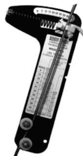
Modelli PRO PT1 - PT2 - PT3 PT-CR