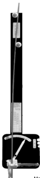
Modelli RT10 e RT11 per tondino